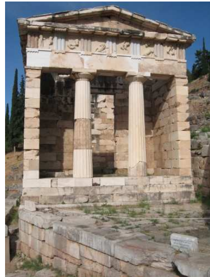
Temple de Delphes appelé « Le trésor des Athéniens »