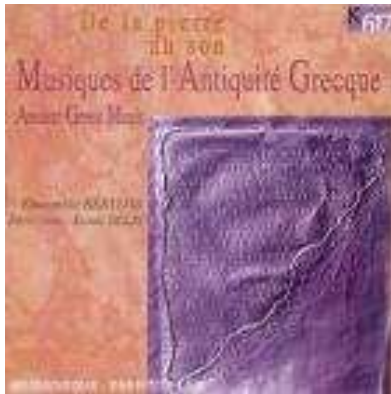
Le CD avec la partition